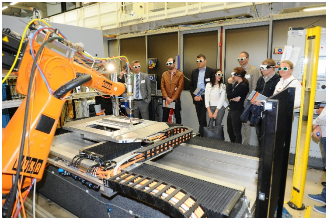
Bild 4: Das Fraunhofer ILT öffnete auf dem AKL'18 während der Veranstaltung »Lasertechnik Live« seine Labore. In Europas größtem Laseranwender-Zentrum konnten sich Teilnehmer über 100 verschiedene Laserprozesse live ansehen.

PRESSEINFORMATION 16. Mai 2018 || Seite 7 | 9