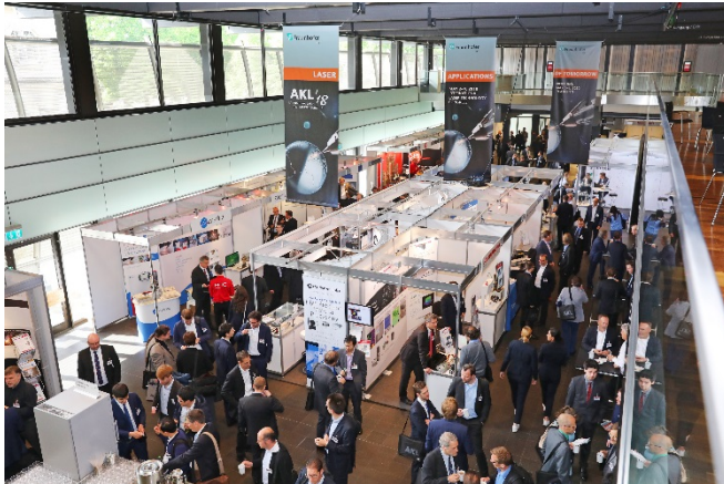
Bild 3: Plattform für lebhaft Diskussionen: 56 namhafte Hersteller von Lasersystemen und - komponenten präsentierten sich auf der konferenzbegleitenden Sponsorenausstellung des AKL'18.

PRESSEINFORMATION 16. Mai 2018 || Seite 7 | 9