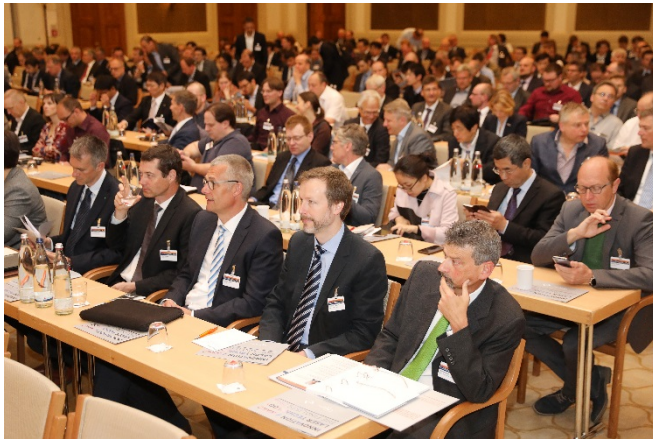
Bild 1: Über 660 Laser-Experten nahmen beim AKL'18 - International Laser technology Congress in Aachen an insgesamt 77 Präsentationen und einer Vielzahl von Rahmenveranstaltungen teil.

Bilder und weitere Informationen zum Innovation Award Laser Technology: www.innovation-award-laser.org